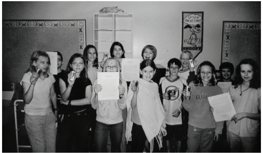
Princess Margaret School sixth grade with their new digital voice recorders

Vor ihrer Ankunft in Kanada wussten die Neufelds, dass Kanada sehr kalt ist, und dass man mehr Arbeit finden und verdienen konnte. Sie waren nicht enttäuscht und sie trafen es besser an als man erwarten konnte. Als sie nach Kanada gekommen